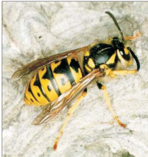
Comité de Alergia a Himenópteros

Redactado por: Miguel Ángel Baltasar Drago